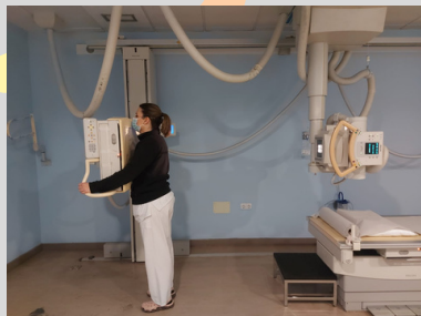
DE PIE JUNTO CON UNA PANTALLA