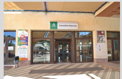
POR LA PUERTA DE CONSULTAS