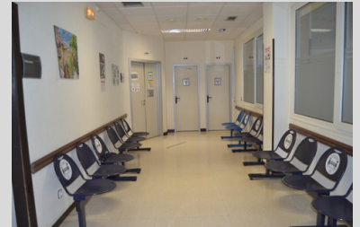
A LA SALA DE ESPERA