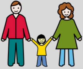
CON MIS PADRES