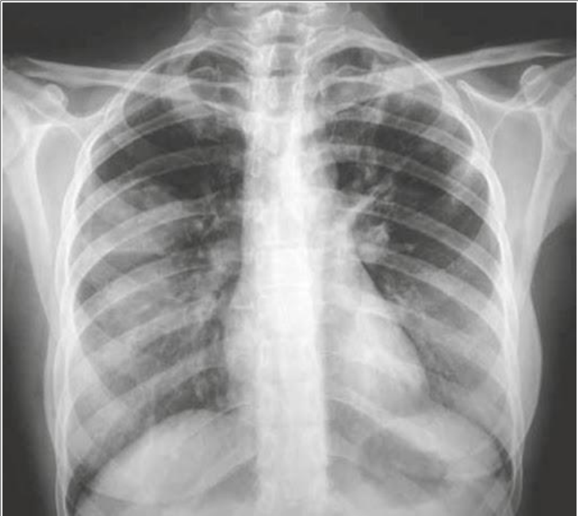
Caso Práctico 5