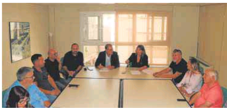
Imagen de la octava Mesa de Calidad Sicted. R. I.

De esta manera, en la actualidad el municipio cuenta con 117 empresas participando en este