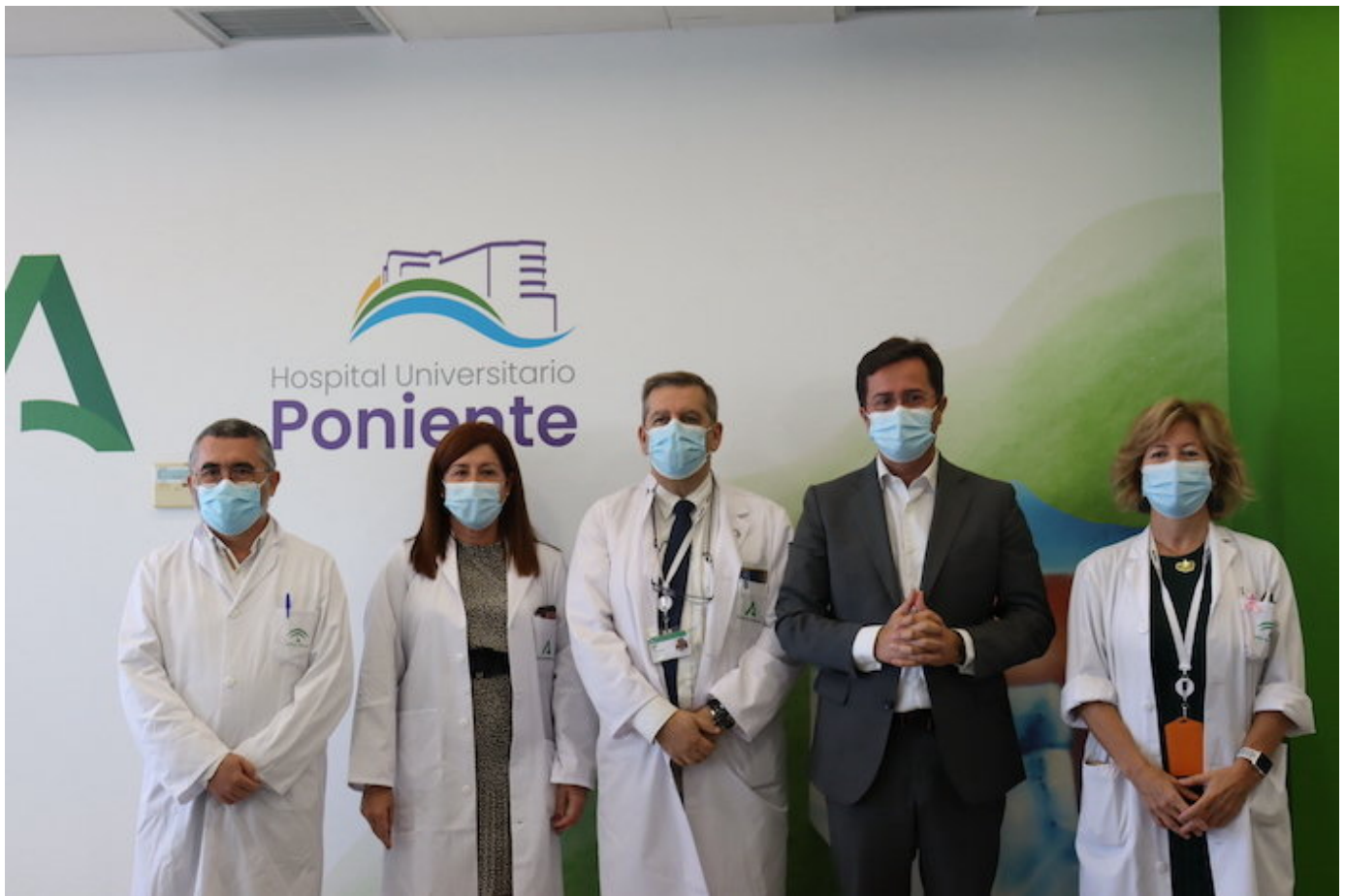
i Congreso SADECA en el Hospital de Poniente

La Sociedad Andaluza de Calidad Asistencial celebra en El Ejido un encuentro centrado en 'El valor de lo humano'