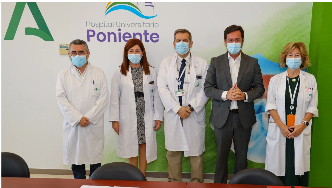
Presentación del XXVI Congreso de SADECA en El Ejido.

200 profesionales de toda Andalucía participan esta semana en el XXVI Congreso de SADECA