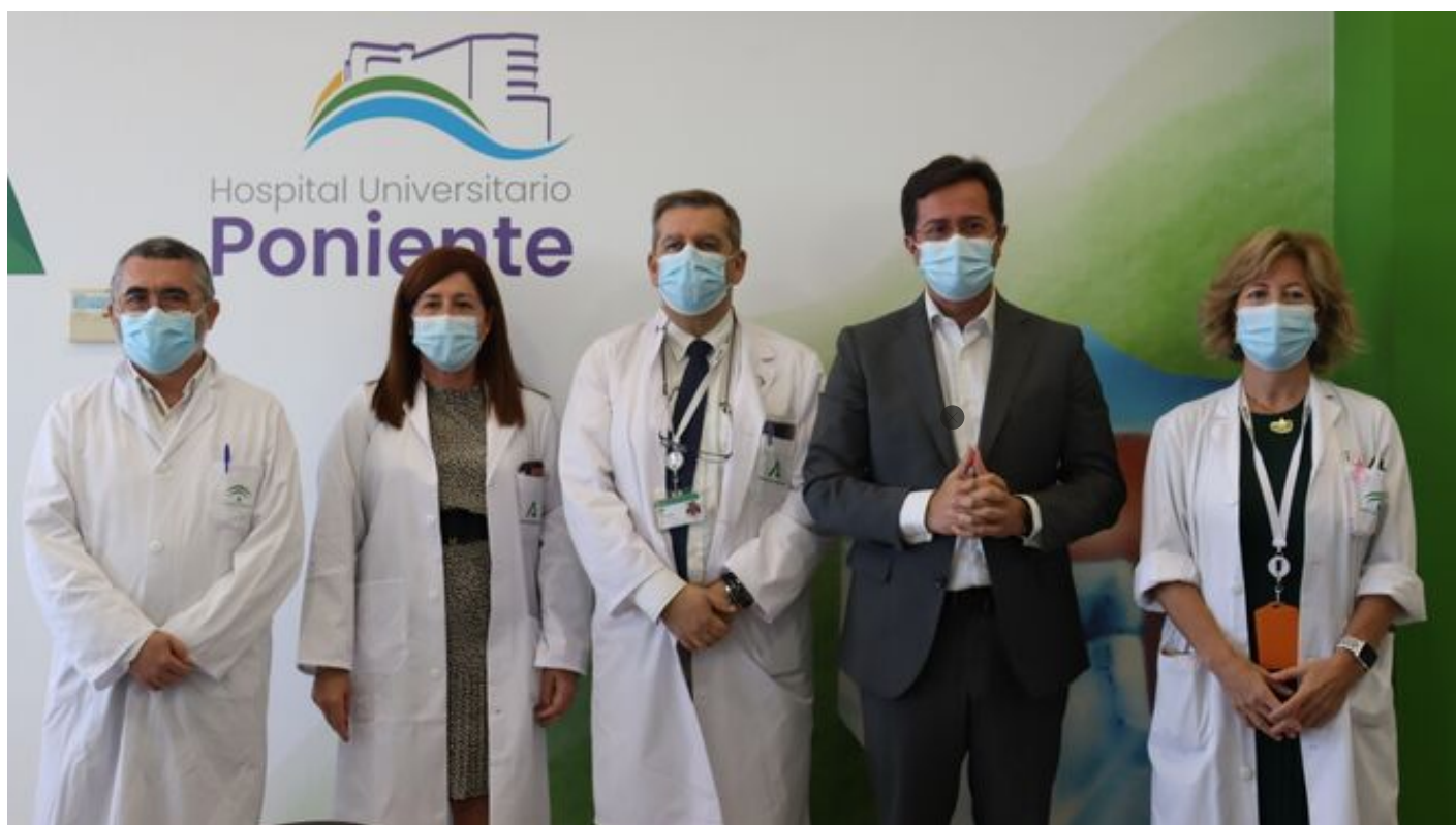
Presentación del congreso.

El lema de la cita es 'El valor de lo humano', teniendo la humanización en la atención un peso específico en este encuentro profesional