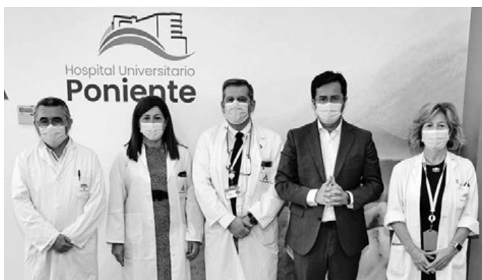
Presentación del XXVI Congreso de SADECA en el Hospital de Poniente. LA VOZ

Asimismo, la presidenta de SADECA y responsable del Servicio de Prevención