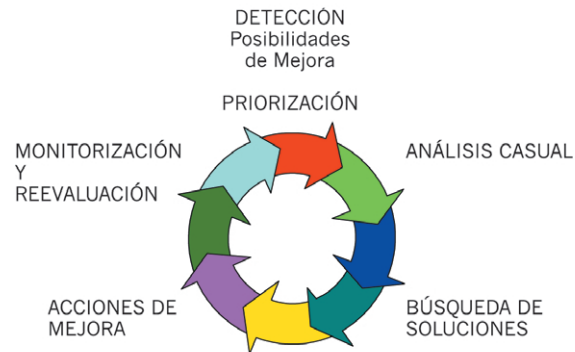
Figura 28. El Ciclo de Mejora.

Es necesario dotar a los responsables del proceso de las técnicas básicas para evaluar la efectividad y eficiencia de los procesos y buscar permanentemente su mejora.