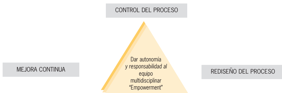
Figura 25. Control y mejora de procesos.