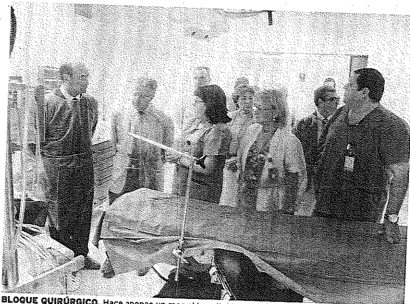
BLOQUE QUIRÚRGICO. Hace apenas un mes el hospital inauguraba tres nuevos quirófanos.

Por otro lado, la directora del Área Integrada de Gestión de Bloque Quirúrgico del Hospital de Poniente recuerda que en el centro hospitalario de El Ejido «los pa-