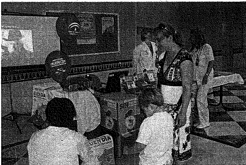
Campaña. Un niño, con su madre no fumadora, recoge un globo en el Hospital.

Por otro lado, desde la concejalía de Servicios Sociales del Ayuntamiento de El Ejido también han participado en la lucha contra este há-