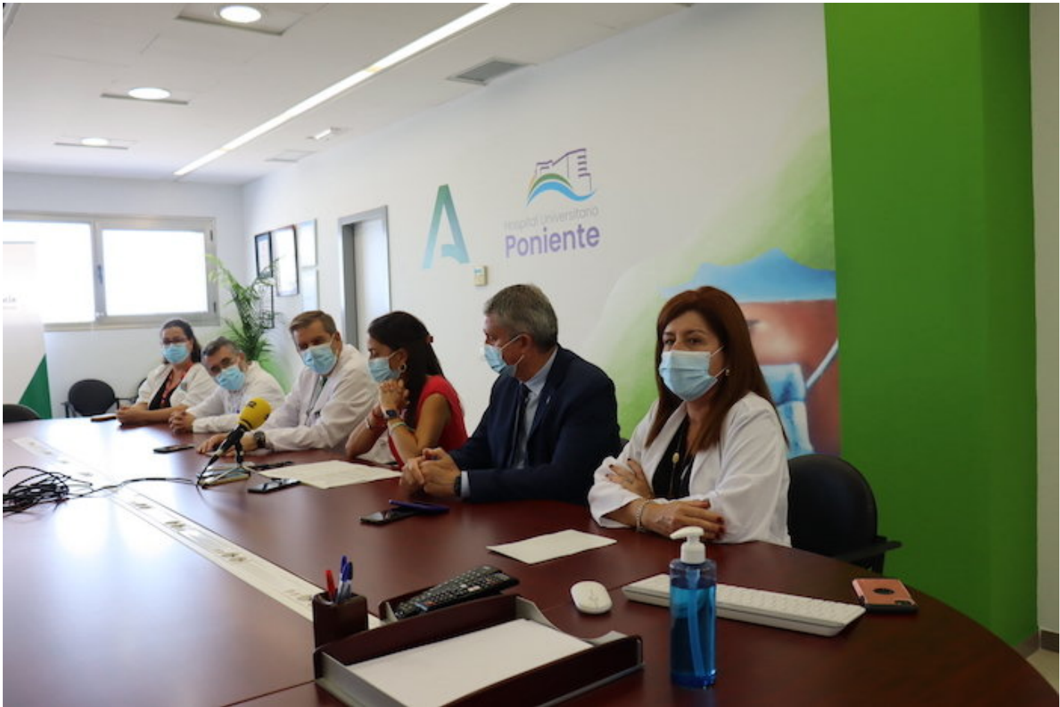
i Presentación Hospitales Humanos en el Poniente

Esta iniciativa, promovida por ROCHE, aúna planes de humanización en la atención sanitaria de diferentes centros españoles