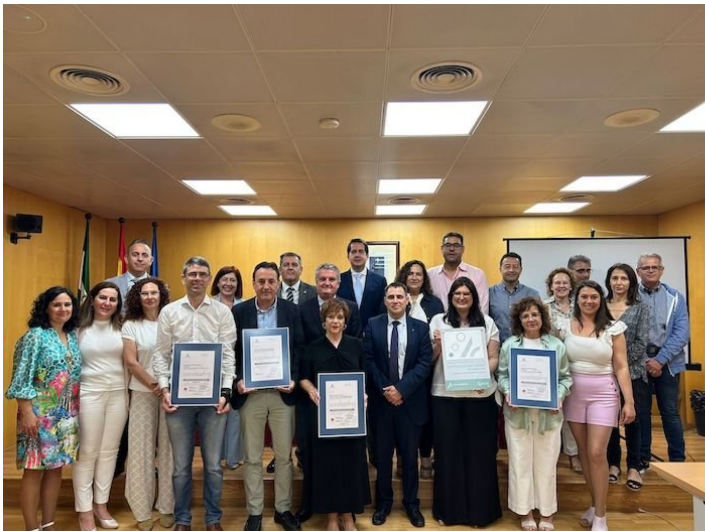
i Certificaciones sanitarias

El delegado territorial de Salud y Consumo en Almería ha hecho entrega de los certificados de calidad a unidades del Hospital Universitario de Poniente, del Área de Gestión Sanitaria Norte y del Distrito Almería